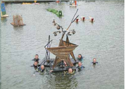
Zandokhan Diving Duikschool