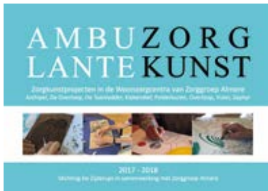
Cover folder - A5 liggend, 20 pagina's

Grijs: Christian Wisse, Oranje: Aleksander Willeme, Donkerblauw: Ninette Koning