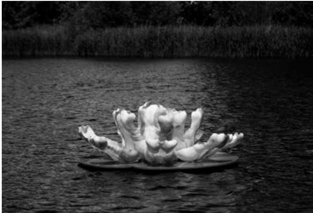
Ingrid Slaa Waterlelie 2015 / Thema WATER - LAND