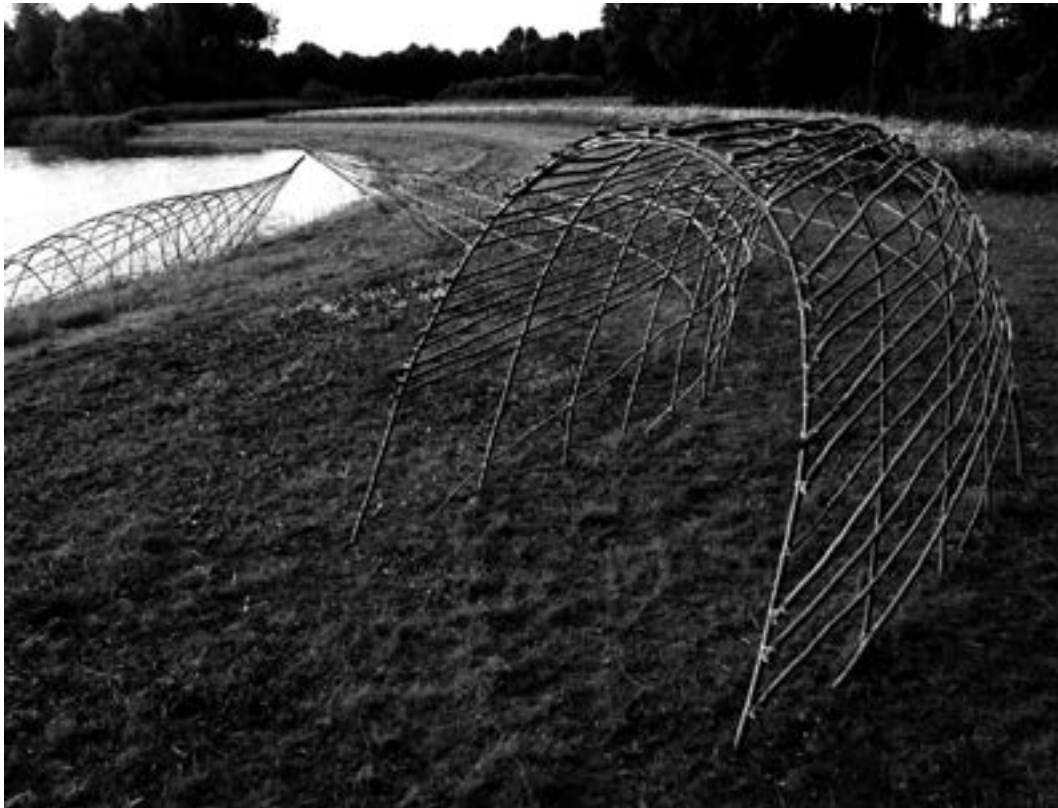
Karin van der Molen zonder titel 2005 / Thema SPOREN

Hier heeft een mammoet gelopen. Hier heeft een mammoet zijn laatste stappen gezet. Hier is het dier 10.000 jaar geleden gevallen, de allerlaatste mammoet gevallen, gestorven en ontbonden. Dit is plaats waar vacht uiteen viel. Waar ribben verweerden, verwaaiden als stof. Vergingen. Vergaan.