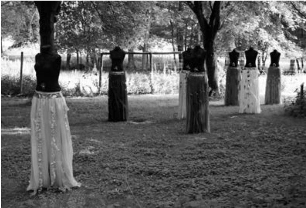
Ninette Koning Het begin 2013 / Thema ER WAS EENS

Er waren eens zeven vrouwen. Wereldwonderen waren het. Prachtig en kleurrijk, sterk en zacht tegelijk. Ze kwamen uit zeven verschillende windstreken, ze waren geboren in zeven verschillende continenten en ze spraken zeven verschillende talen - het waren echt zeven volkomen eigen en zelfstandige vrouwen.