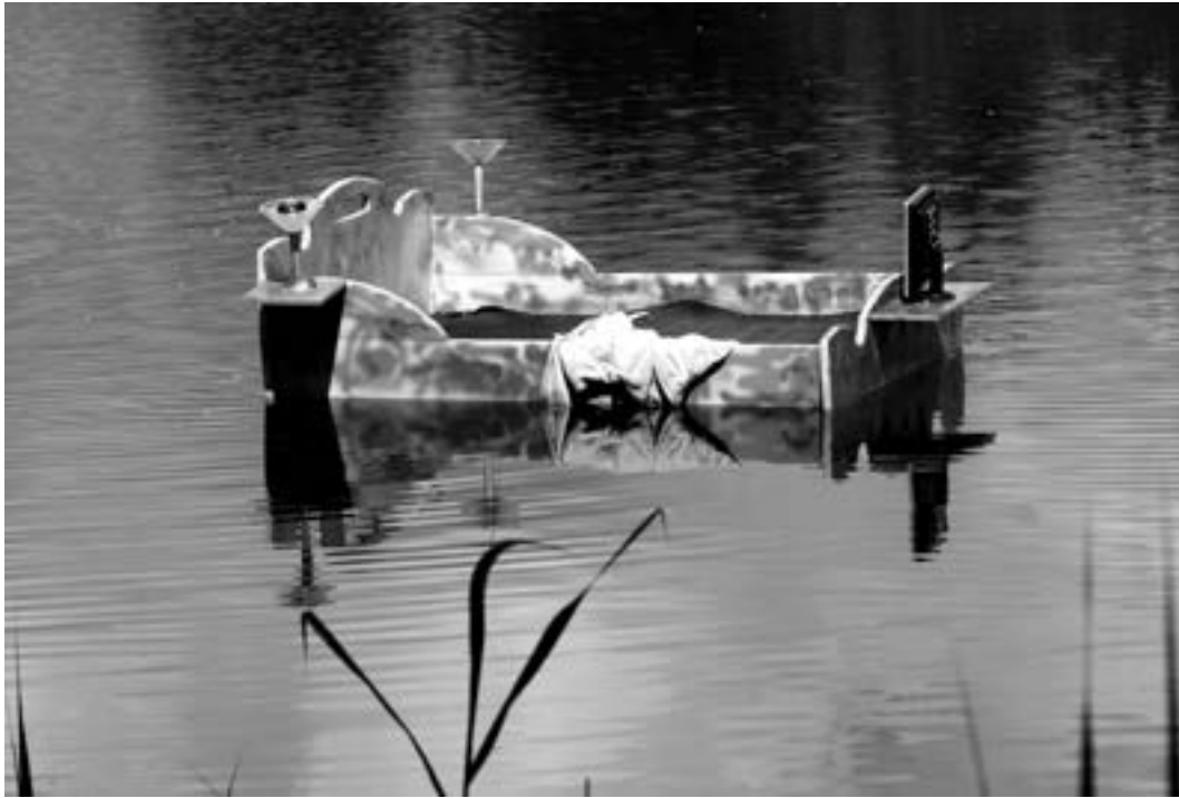
Gonny Geurts Zonder titel 2015 / Thema WATER - LAND