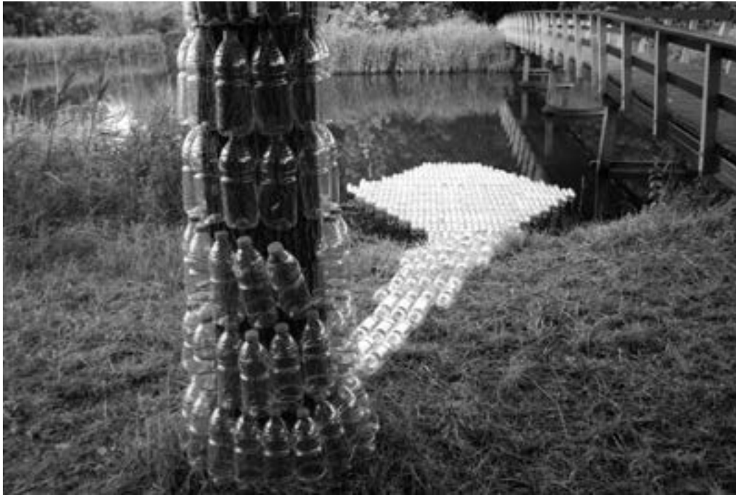
Anita de Harde Plastic 2014 / Thema VISIOENEN