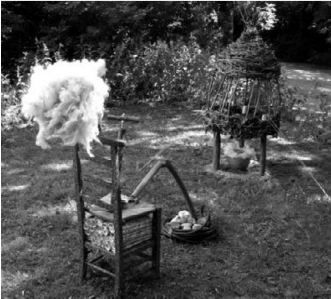
Sia Schipper De dualist 2006 / Thema VREEMDE VOGELS

Wie wil voelen hoe de vroege mens, een vreemde eeuwigheid geleden,