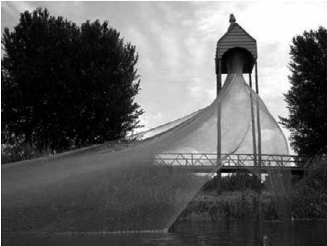
Pat van Boeckel Tower of wind 2008 / Thema BURL

Galmt de klok, het bijna verklonken brons, het hart van tijden vervlogen, ons