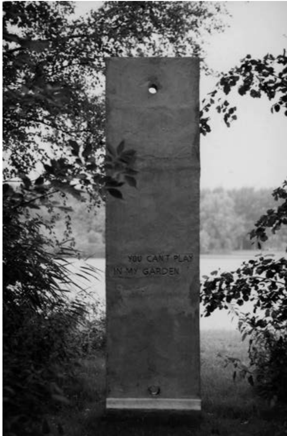
Anthea Simmonds You can't play in my garden 2007 / Thema ONTSLUITEN / AFSLUITEN

Er waren eens twee meisjes, twee meisjes hand in hand, er waren eens twee meisjes, de tuin was kinderland.