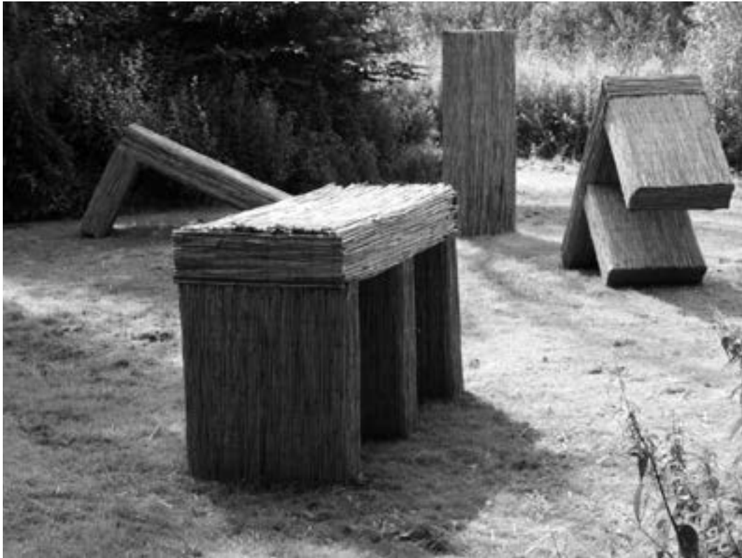
Jan Coenen LIFE 2005 / Thema SPOREN

Het schrift is de brug tussen de onzichtbare taal