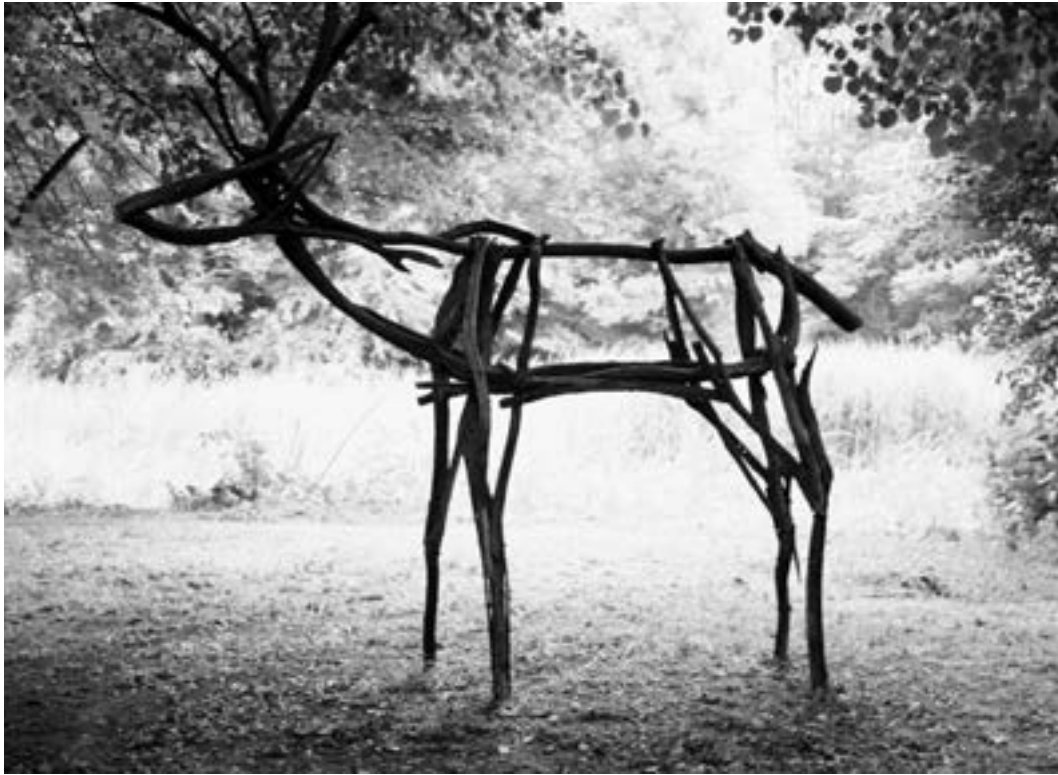
Geert van der Pol Living proof 2009 / Thema PROOF