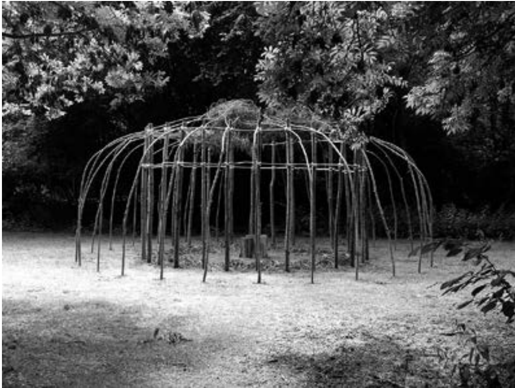
Mariël Bisschops Priëel 2006 / Thema VREEMDE VOGELS