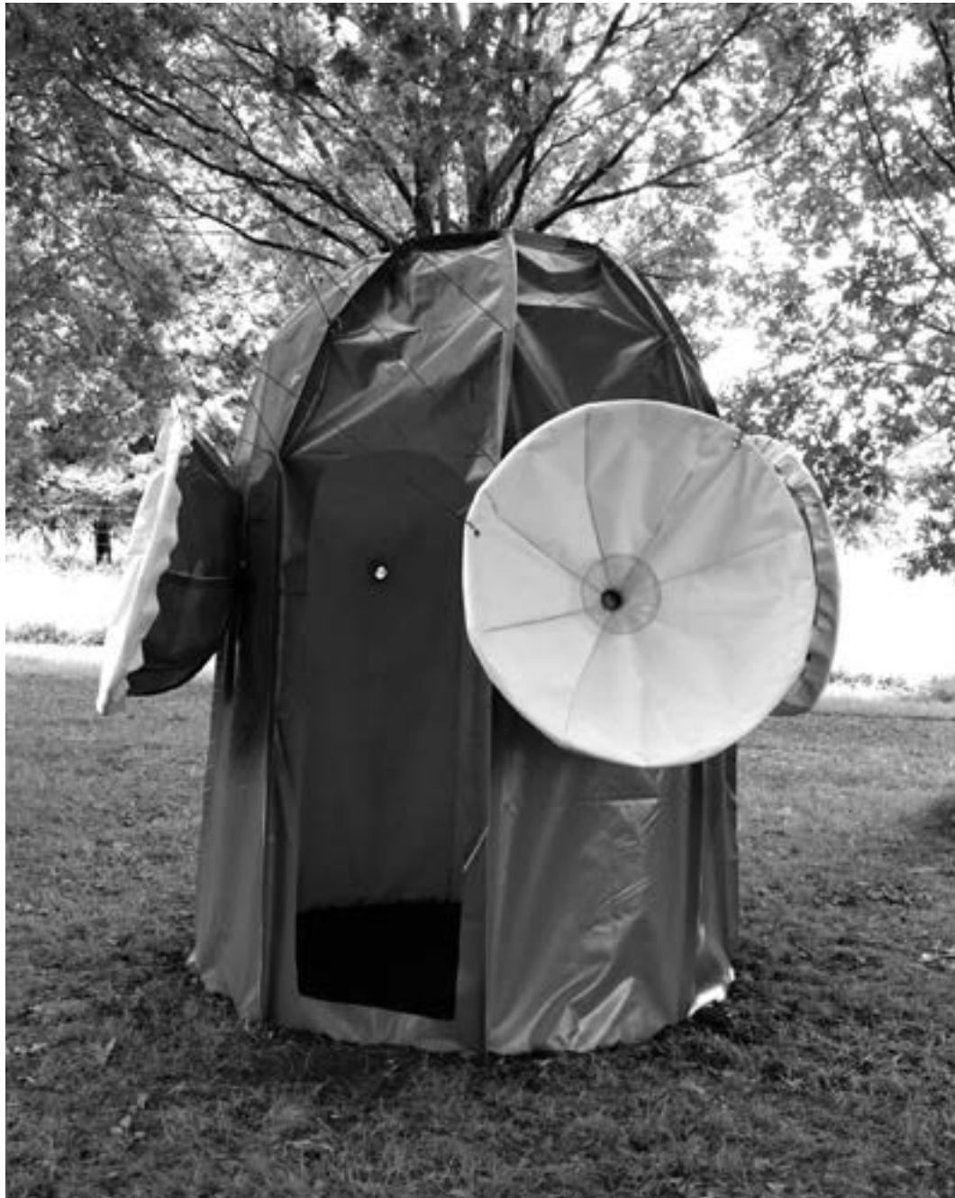
Mannie Krak ReShelter 2.0 2017/ Thema IN

Ga binnen, sluit je ogen, laat het donker je omarmen.