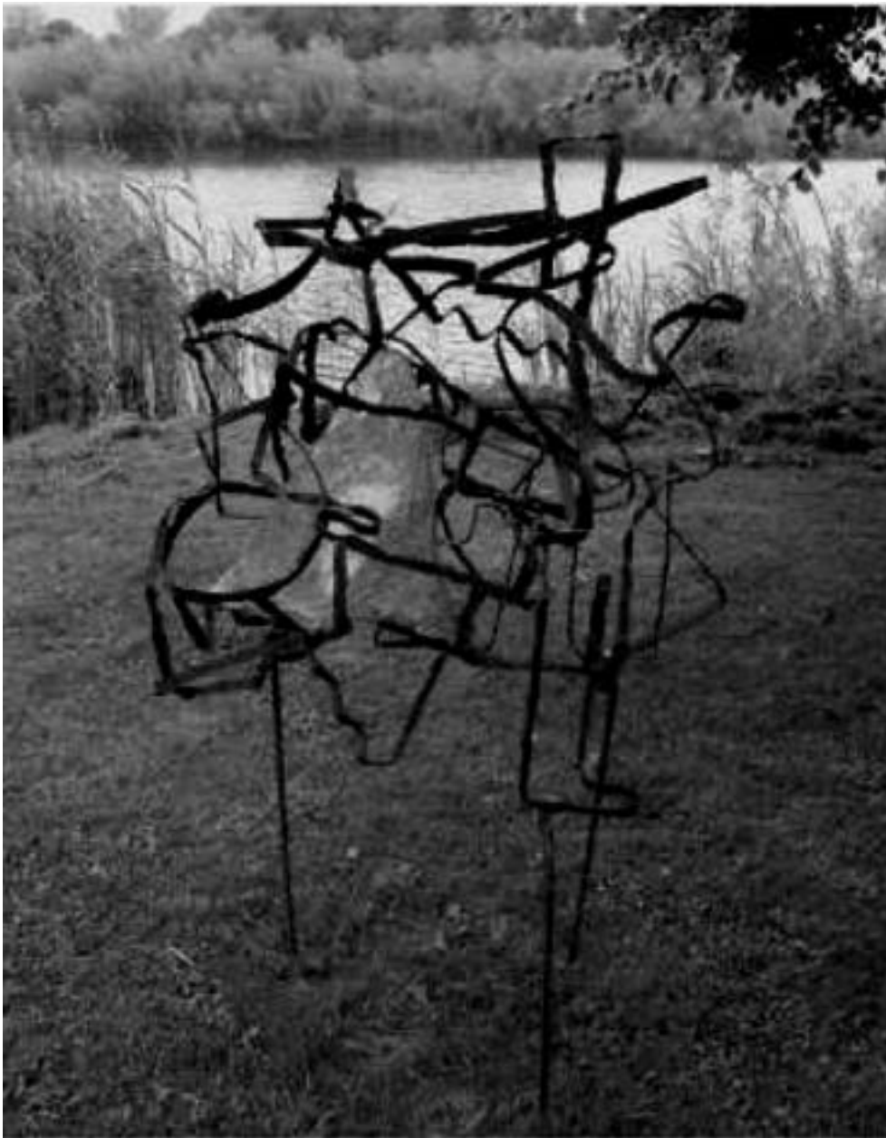
Saskia Burleson Zonder titel 2009 / Thema PROOF

Het spel van de constructie neemt dertel bezit van de ruimte;