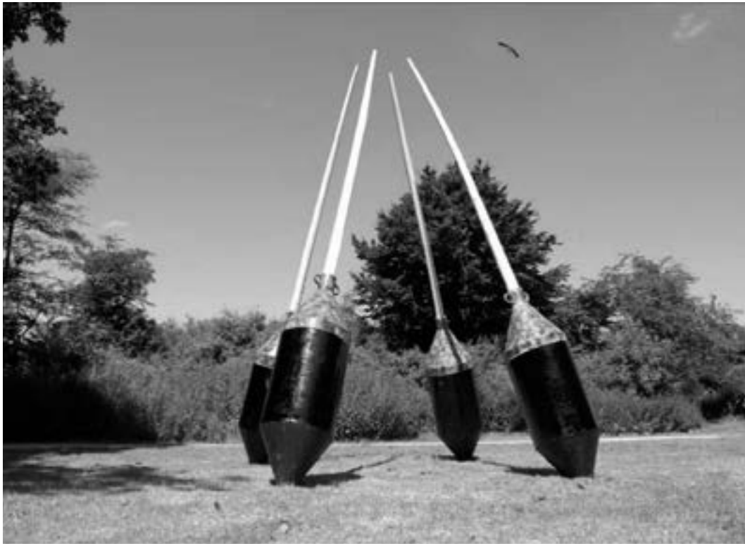
Rob van den Broek Brulboei 2008 / Thema BURL

Ik zie ze nog boeiend en brullend, kolkend en klokkend, elkaar in golven belagend, opjagend, bestokend als jeugdige bokken, getijden trotserend met lansen als ridders, als herten met punten, geweien, messcherpe zwaarden, bij tijd en wijlen een schip dat te ver gaat verjaagd, als Don Quichotten tegen molens –