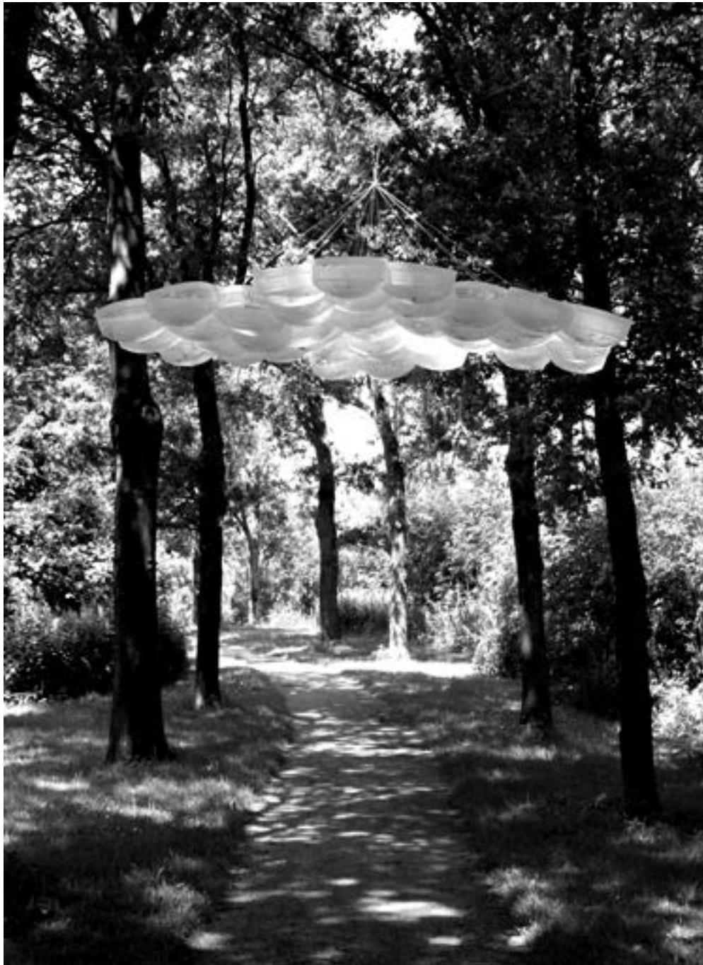
Mary Fontaine Zonder titel 2011 / Thema ZEVEN

Witte bloem, betoverend in de hoogte hangend tussen groene bomen. Stralende bloemkelk van plastic, object van huishoudelijke schoonheid.