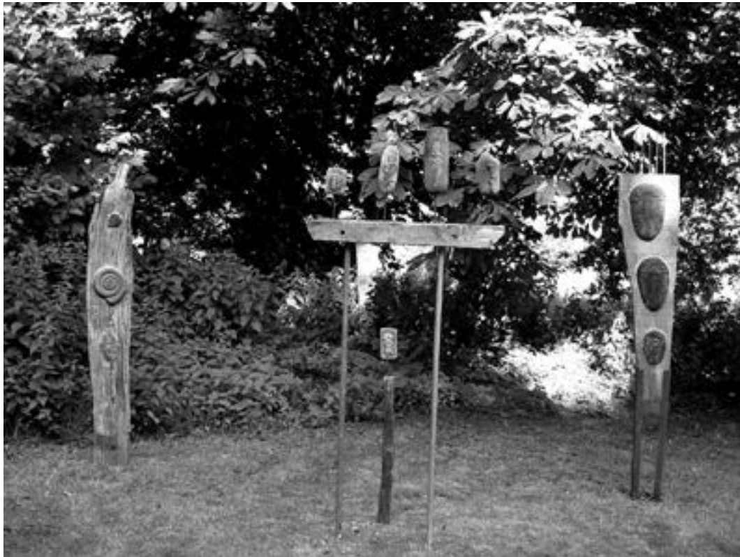
Cor Sonke zonder titel 2005 / Thema SPOREN

Versteende bladeren en diertjes, totempalen vol fossiele ammonieten,