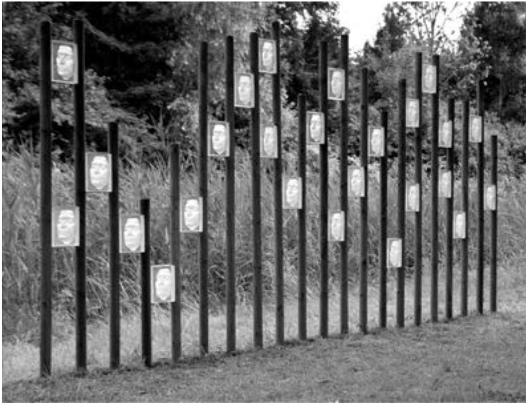
Ingrid Slaa InGrid 2017 / Thema IN

Verplaats jezelf in mij en je voelt dat ik