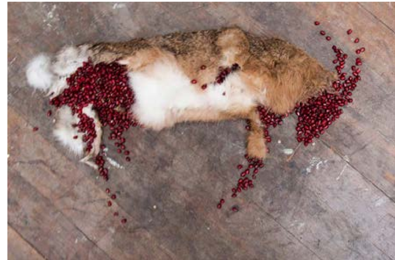
Het feestmaal der moderne ridders: Haas

De tafel fungeerde als sociale ontmoetingsplek waar weer nieuwe verhalen konden ontstaan. Zo bleven er zelfs nog tijdens de afbouw in het Atrium twee mannen met hun boterhammen aan de tafel zitten, terwijl wij de kannen en bekers al aan het loszagen waren.