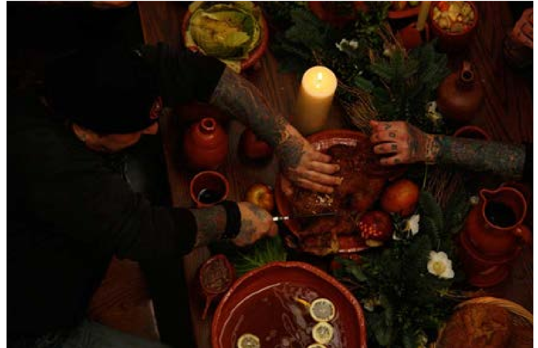
Het feestmaal der moderne ridders: performance

Op deze manier zou ik graag verder willen werken in de toekomst. Ik vind het geweldig als mijn werk mensen kan samenbrengen."