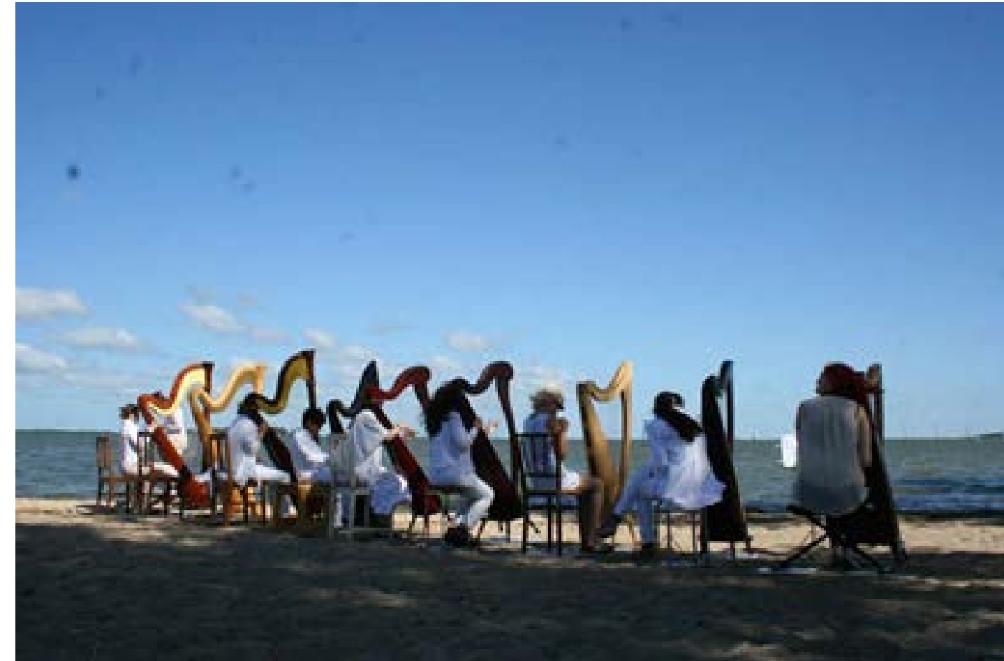
Een ode aan de zee: Seaside serenade

De belangrijkste eigenschap van de performance was het samenzijn, samensmelten door middel van muziek en drank.