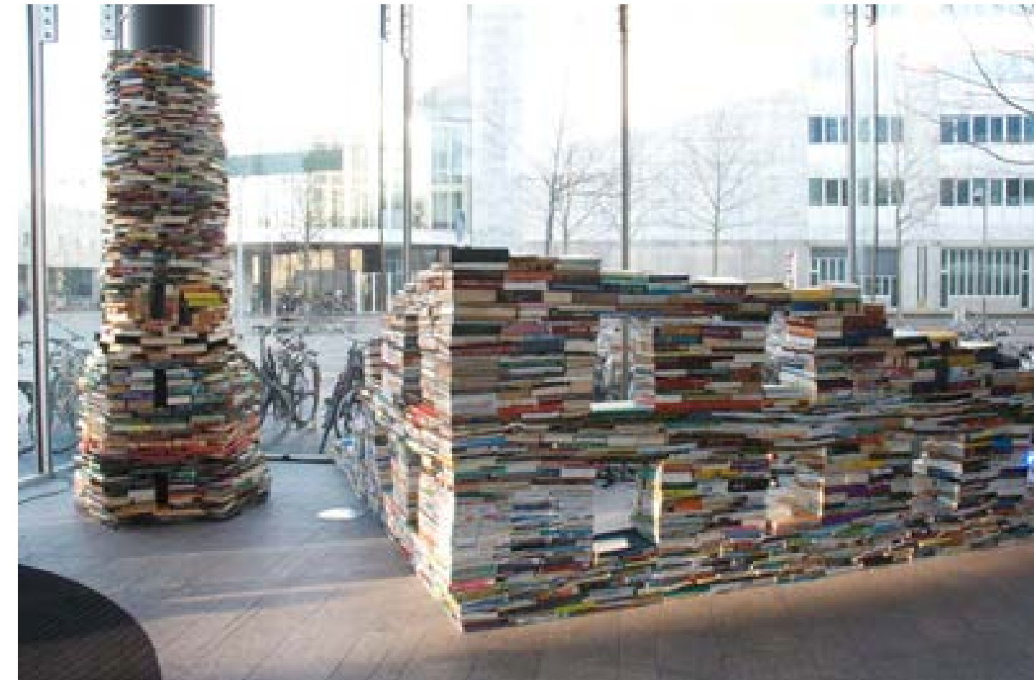
Stad van boeken: rechterzijde

Ik ben nooit deel geweest van studentenrituelen en voor mij zijn het legenden over een andere cultuur, vriendschap en volwassen worden. Mijn nicht die wel aan deze rituelen meedeed vertelde er altijd sterke verhalen over. En zo kreeg het ritueel in mijn verbeelding een heel eigen vorm, die heb ik gebruikt voor mijn performance waar ik twaalf Antwerpse studenten voor naar Den Haag haalde en liet zingen en drinken.