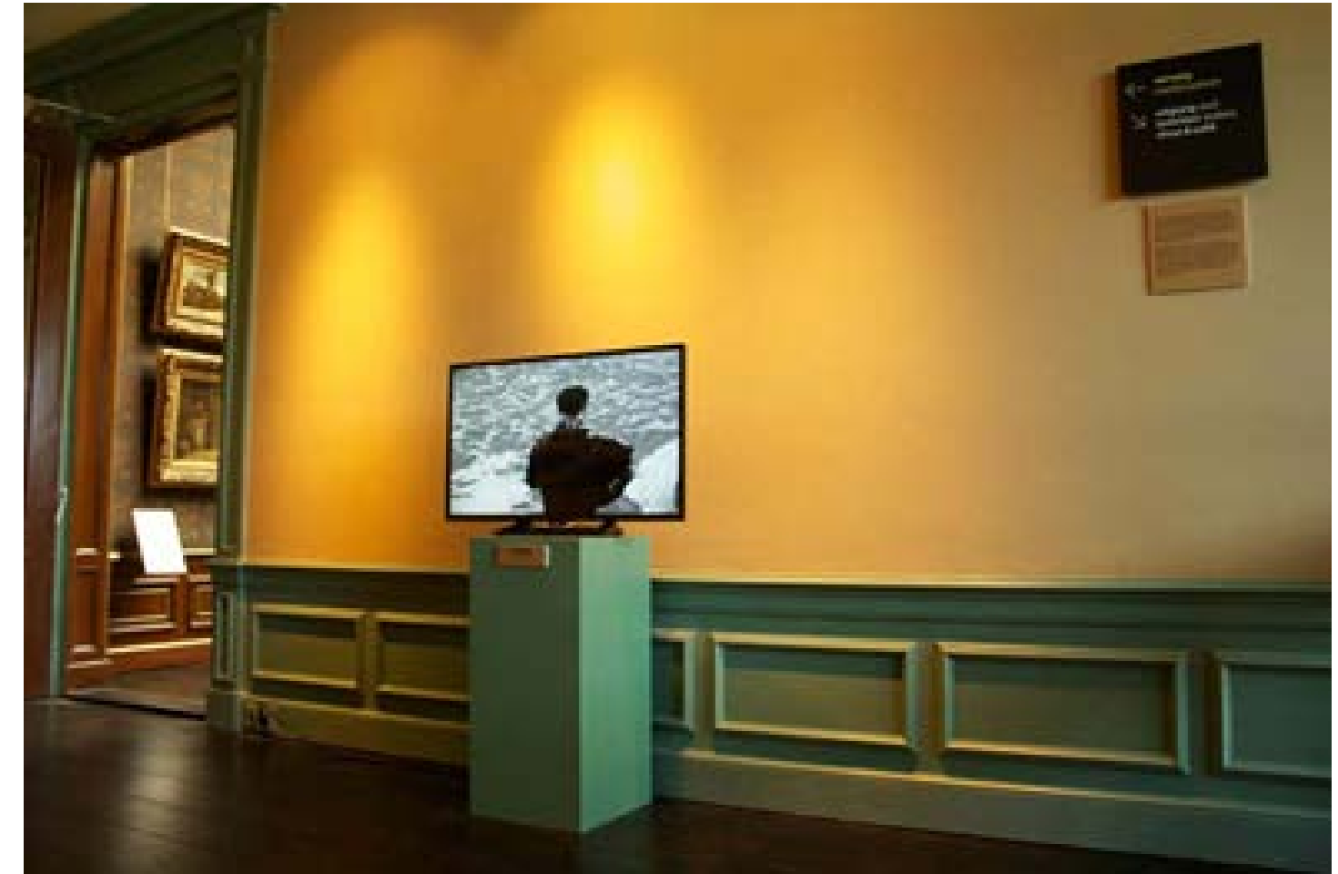
Een ode aan de Zee: Sirenes lied

Ik koos ervoor een performance te creëren waar een Vlaams studentenritueel wordt uitgevoerd, een oud gebruik om een hechte groep te vormen door middel van het gezamenlijk drinken en zingen van volksmuziek.