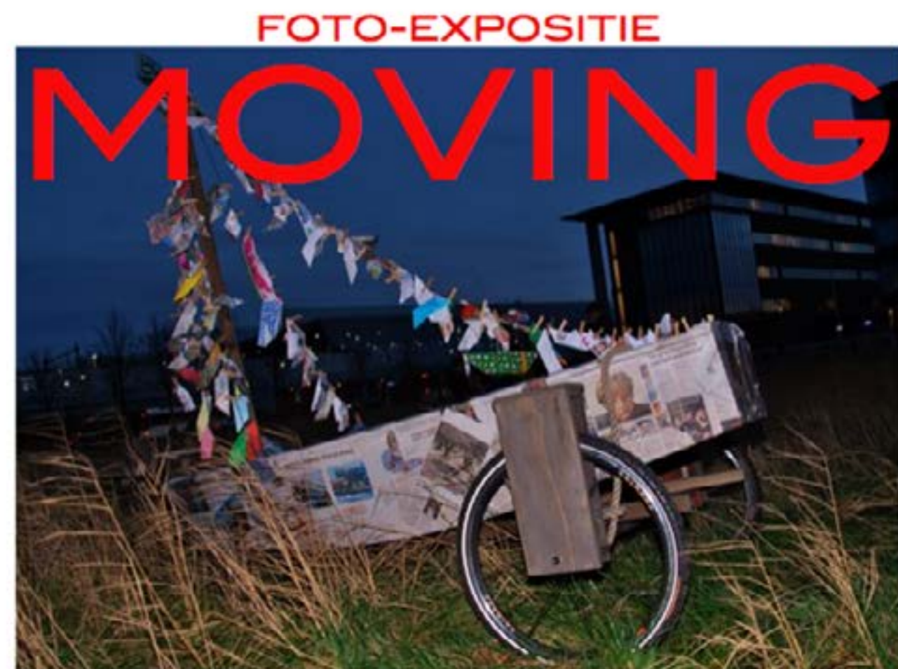
MOVING de kracht van een klein gebaar, met beeld, boek en boot.