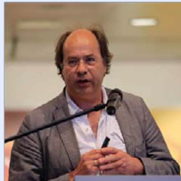
Moderator en sprekers van tijdens het symposium Migratie.