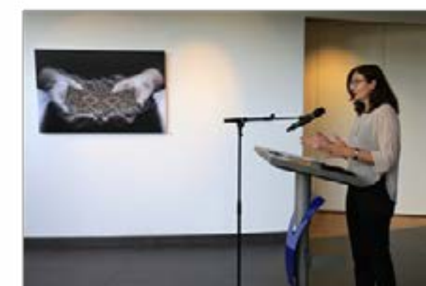
Het symposium Migratie in het Provinciehuis in Lelystad.