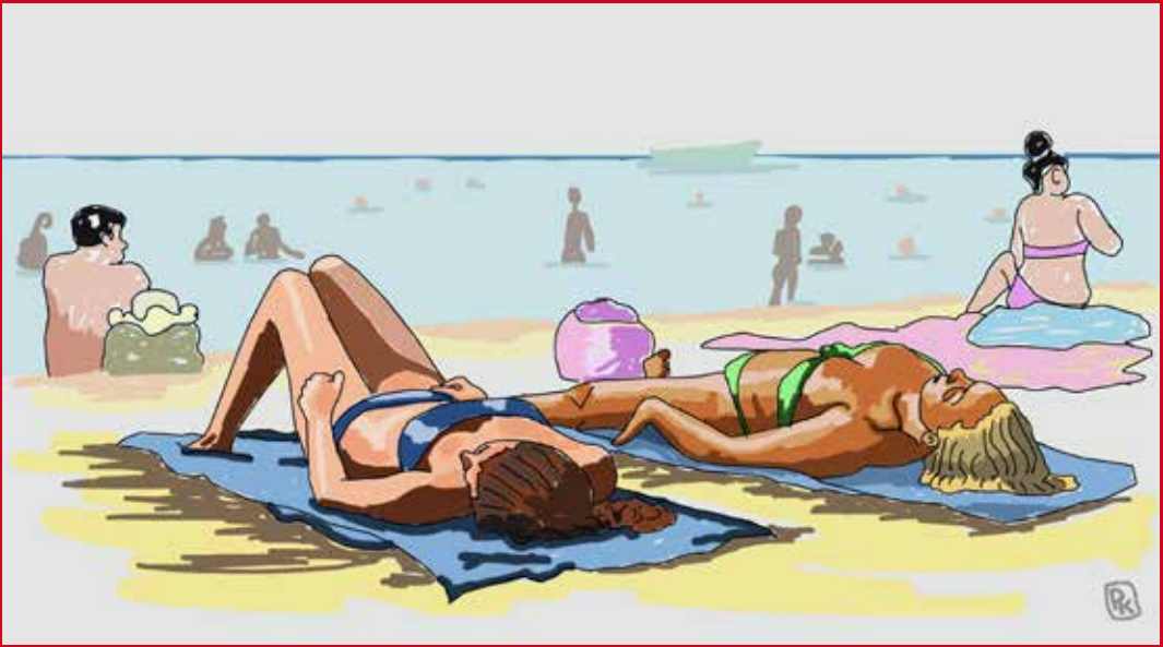
Suddervlees - Peter Koelman

Terwijl onze aandacht uitgaat naar het nu, met angst en beven voelend hoe het maatschappelijke leven verstilt, en zien we hoe dagelijks de maatregelen scherper worden, hunkeren we naar een doodnormale zomer; zo'n zomer aan het strand, lekker bakken in de zon, zonder dat we ons zorgen maken over ons inkomen, opdrachten, familiebezoekjes, etc.