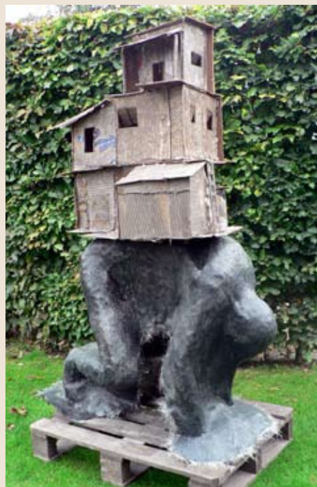
afmetingen : 1,10 x 0,60 x 1,70 m materiaal : hars en glasmat, karton