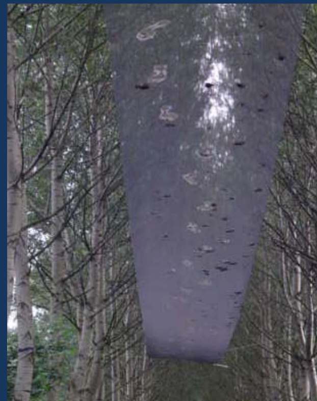
Sporen - door Gonny Geurts

Stuur een mail naar heinwalter@tiscali.nl . Gebruik dit adres ook voor kopij. Informatie over CUNST: 06 51924882