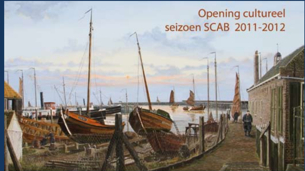
Opening cultureel seizoen SCAB 2011-2012

Maandag t/m donderdag 09.00 uur – 12.30 uur / 14.00 uur – 16.30 uur Vrijdag 09.00 uur – 12.30 uur