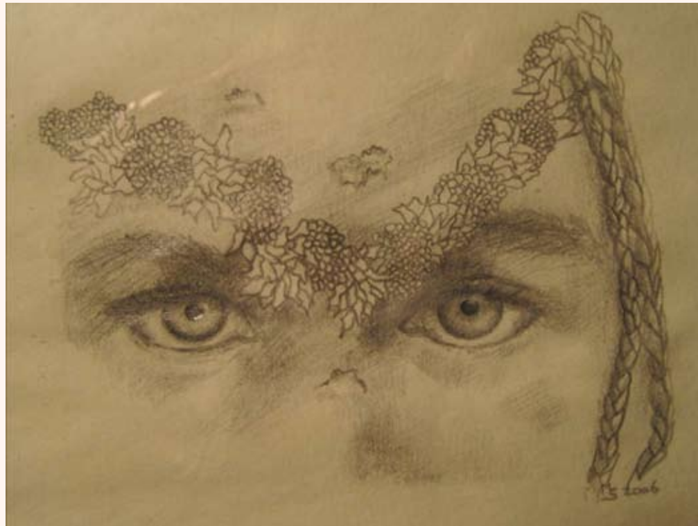
Zonder titel Potlood op papier 15 x 15 cm 2004