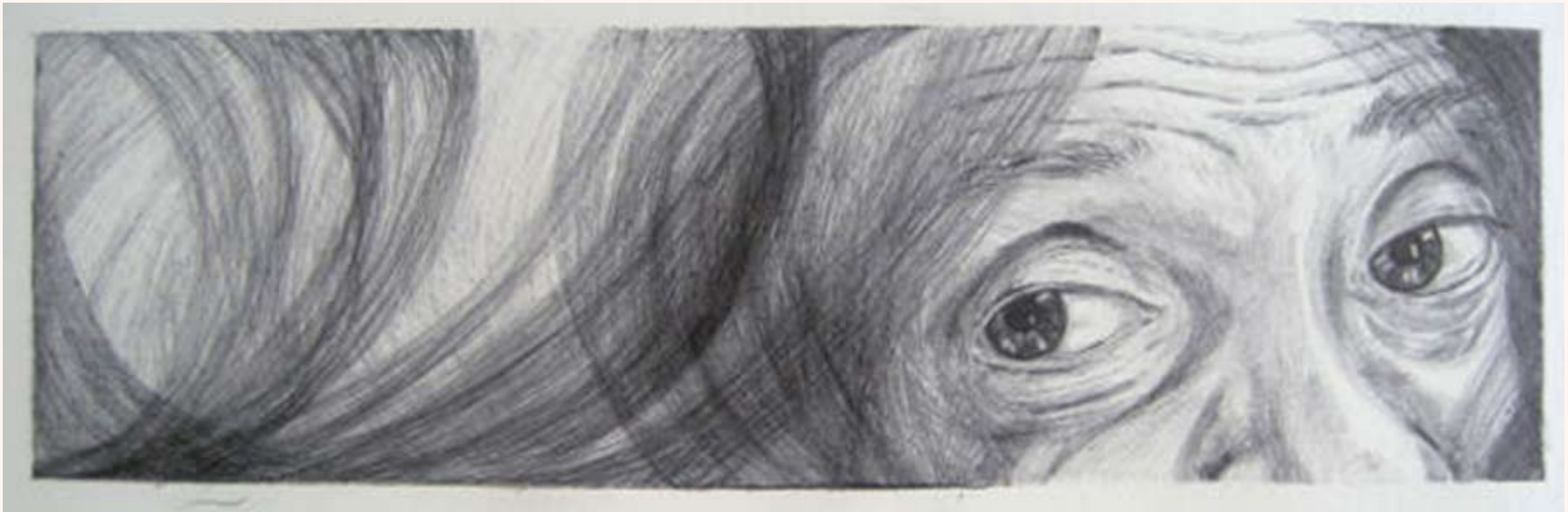
Zonder titel Balpen op papier 10 x 30 cm 2004