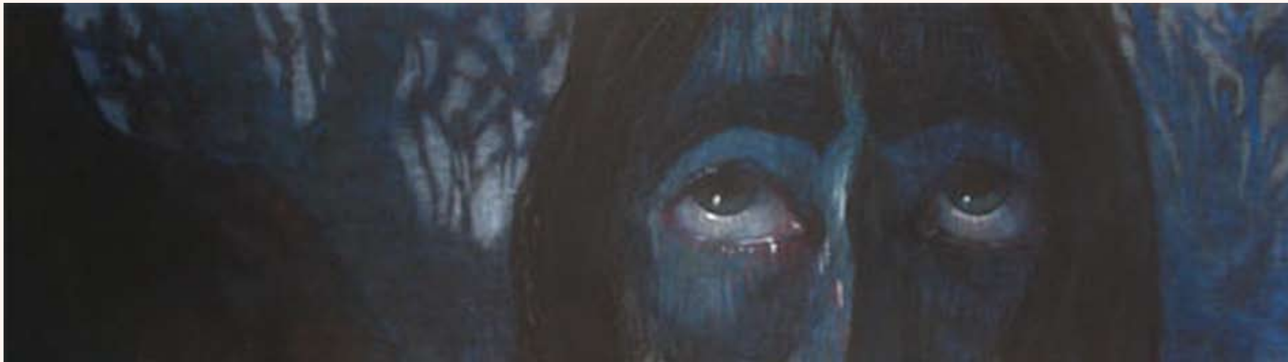
Gethsémane Pastel op doek 50 x 200 cm 2005