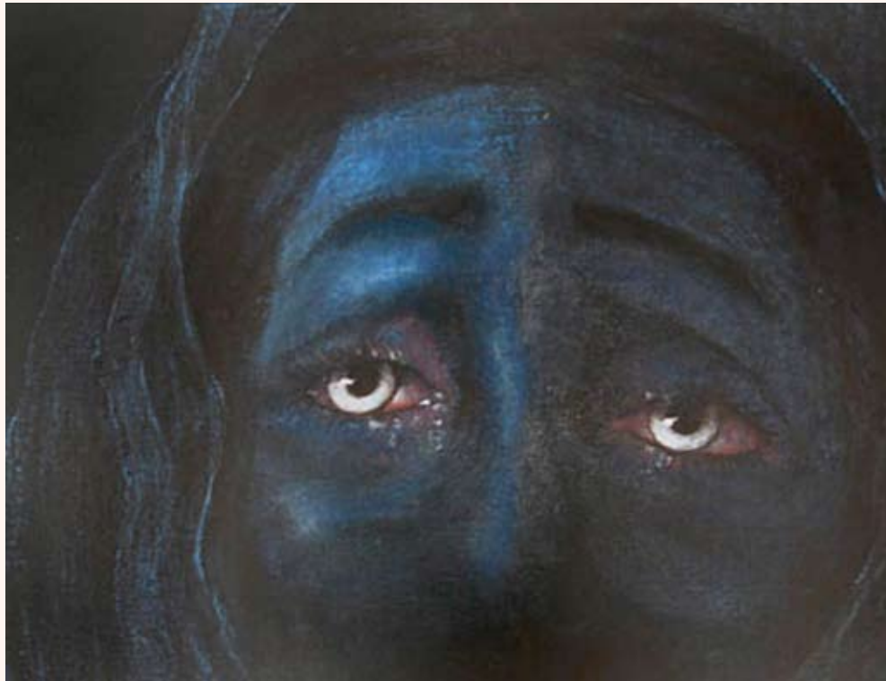
De vrouw Pastel op doek 50 x 60 cm 2005