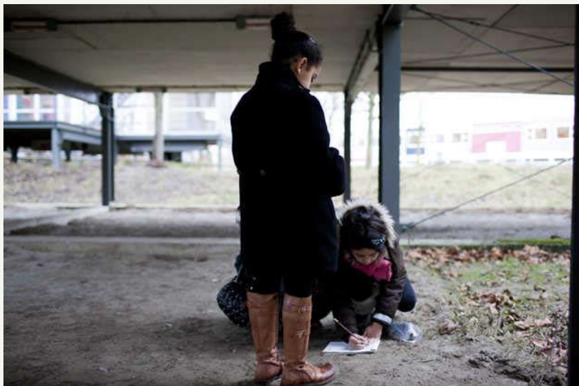
www.museumdepaviljoens.nl

Wat? Workshop Herrekijken Voor wie? Kinderen van 6 tot 12 jaar Wanneer? Woensdag 4 april, 14.00 - 16.00 uur Waar? Museum De Paviljoens, Odeonstraat 3, 1325 AL Almere Kosten? € 2,- per kind Aanmelden? Stuur een e-mail of bel 036 545 0400