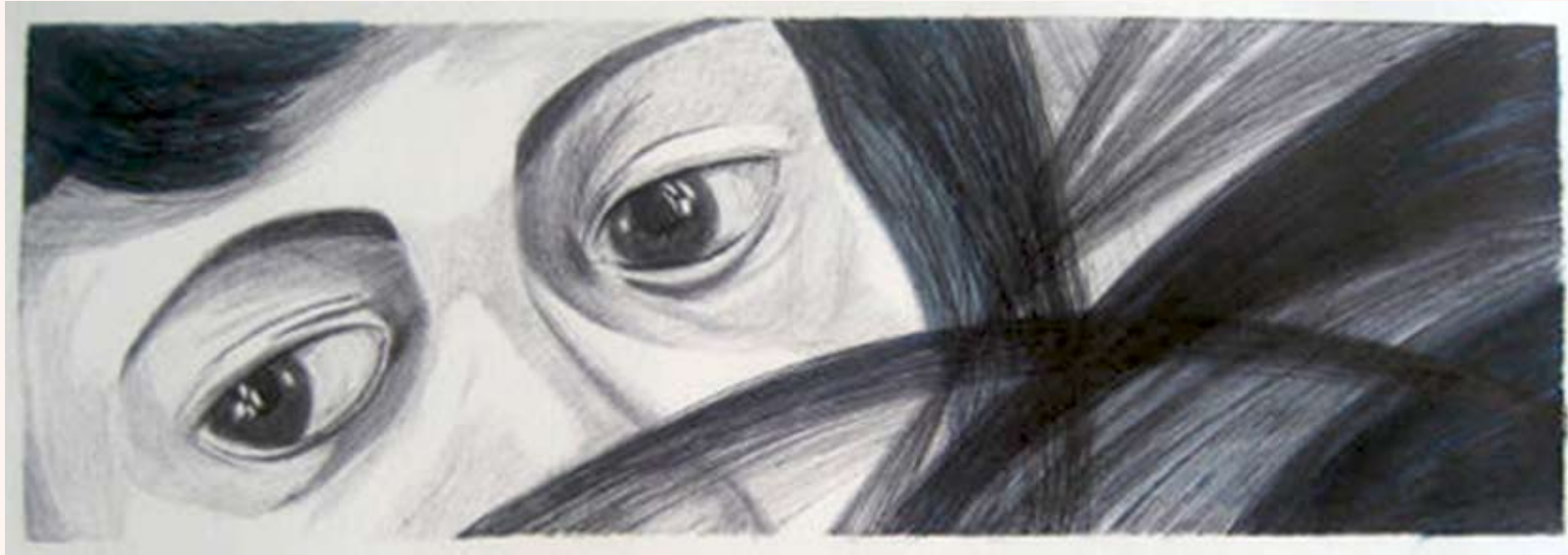
Zonder titel Balpen op papier 10 x 30 cm 2004