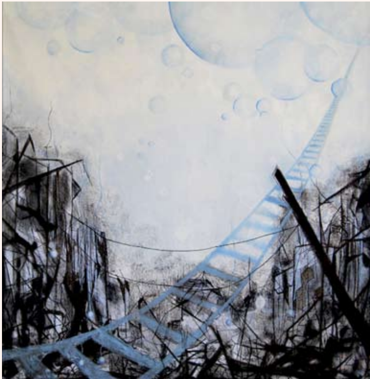
Hemel en Aarde Pastel op doek 220 x 210 cm 2011