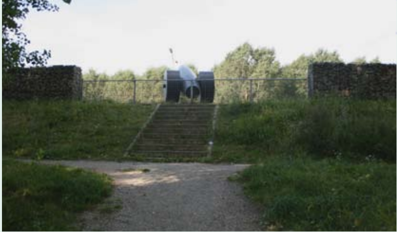
Het schrijfkanon Peter Zegveld 2011 Hoge Ring - Almere Literatuurwijk Brons, bakstenen sokkel 2,3 x 2,0 x 4,6 meter