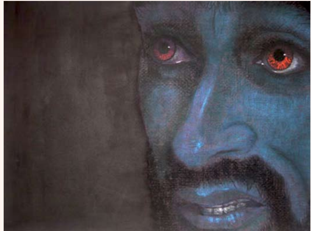
Petrus Pastel op doek 80 x 110 cm 2006