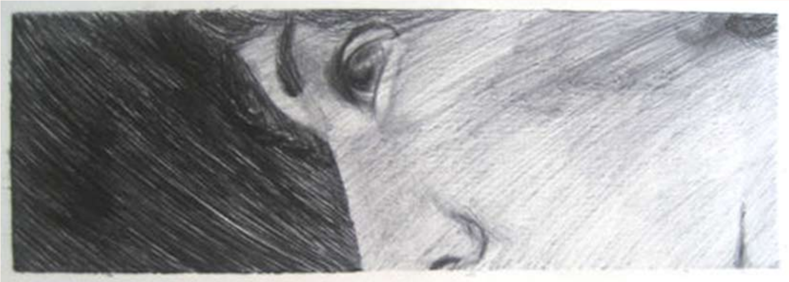
Zonder titel Balpen op papier 10 x 30 cm 2004