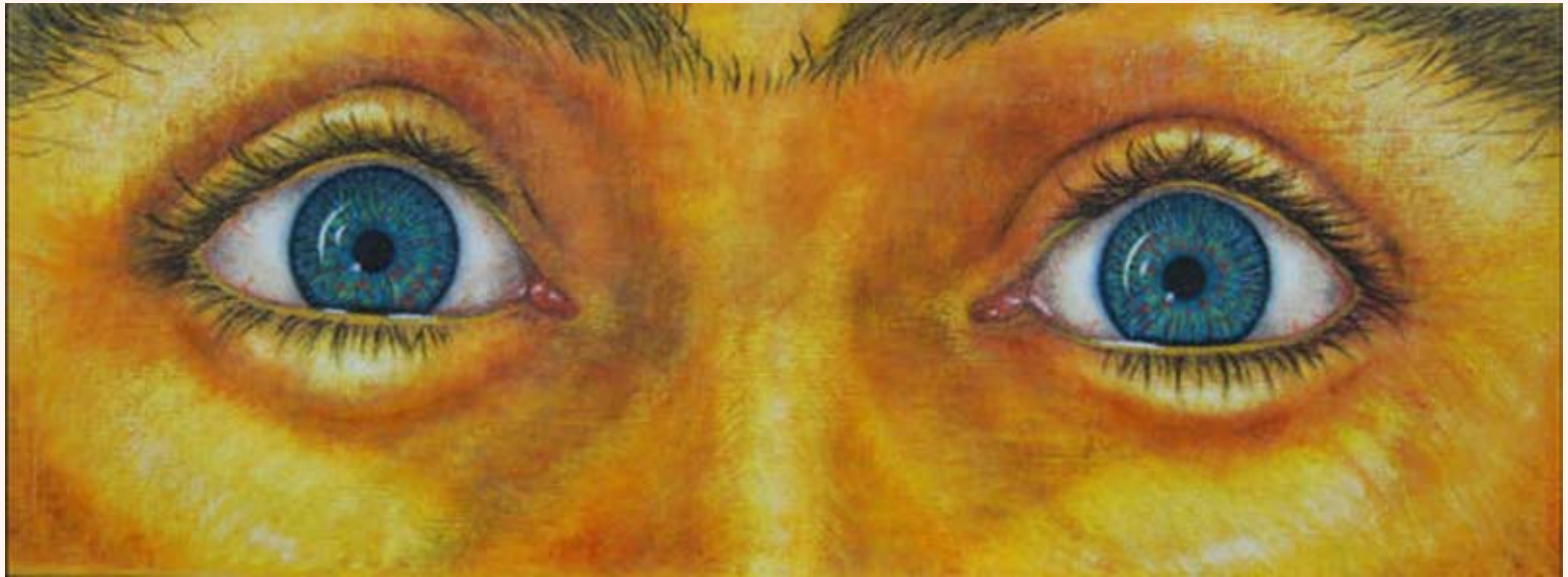
Resurrection Gloria Pastel op doek 75 x 200 cm 2006