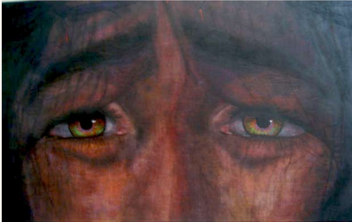
Ecce Homo (1) Pastel op doek 120 x 200 cm 2005