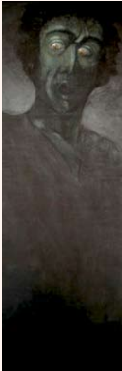
Judas Pastel op doek 60 x 190 cm 2005