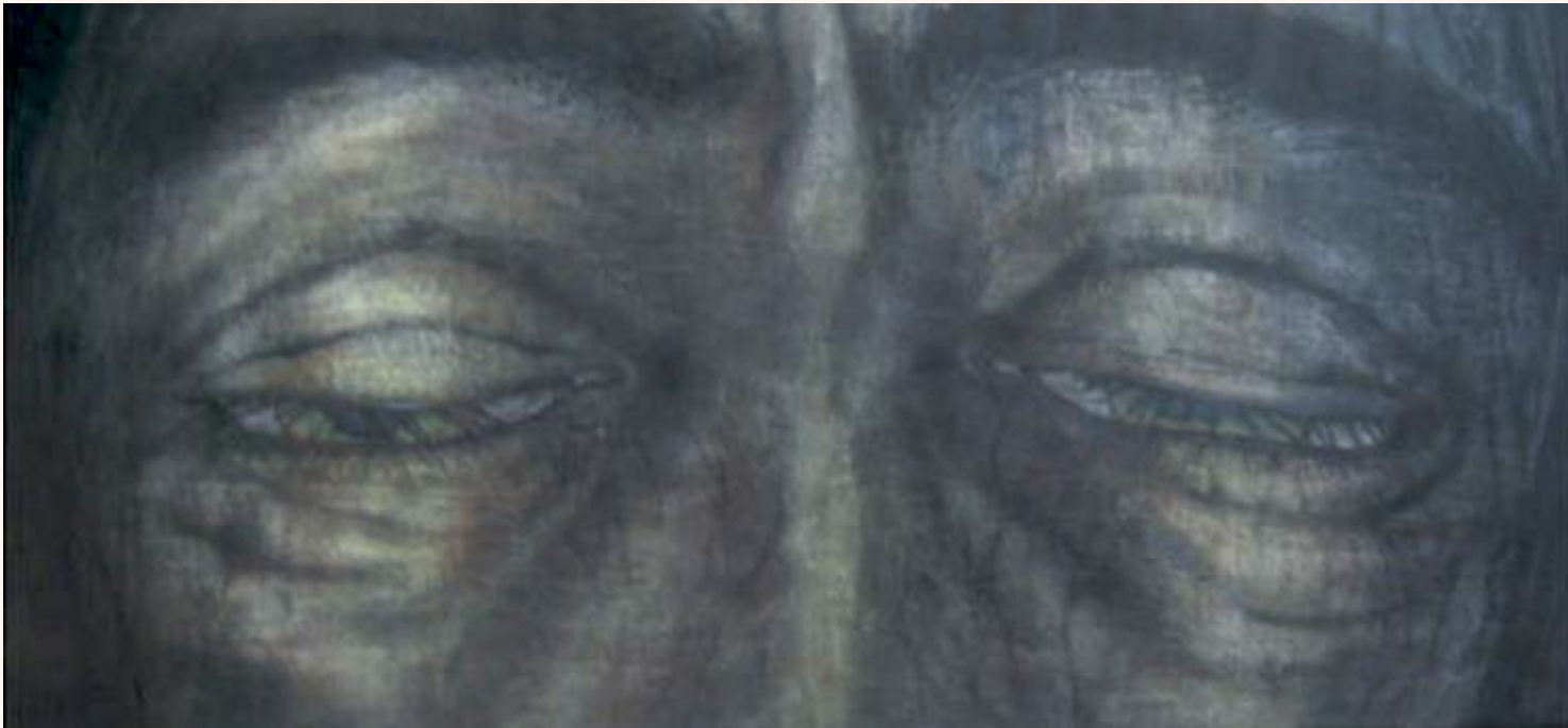
Ecce Homo (2) Pastel op doek 90 x 200 cm 2005