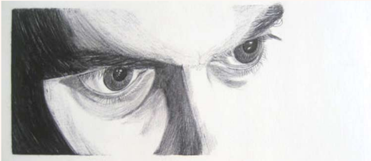
Zonder titel Balpen op papier 10 x 30 cm 2004