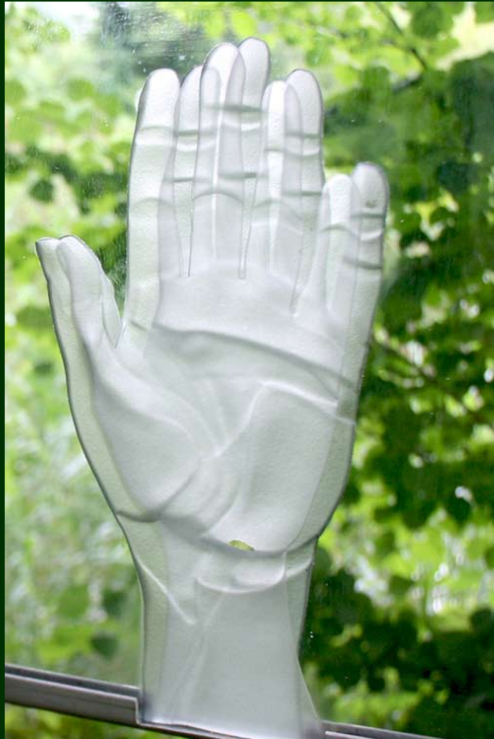
BOMEN OVER HET GELOOF EN VOORBIJ HET GELOOF