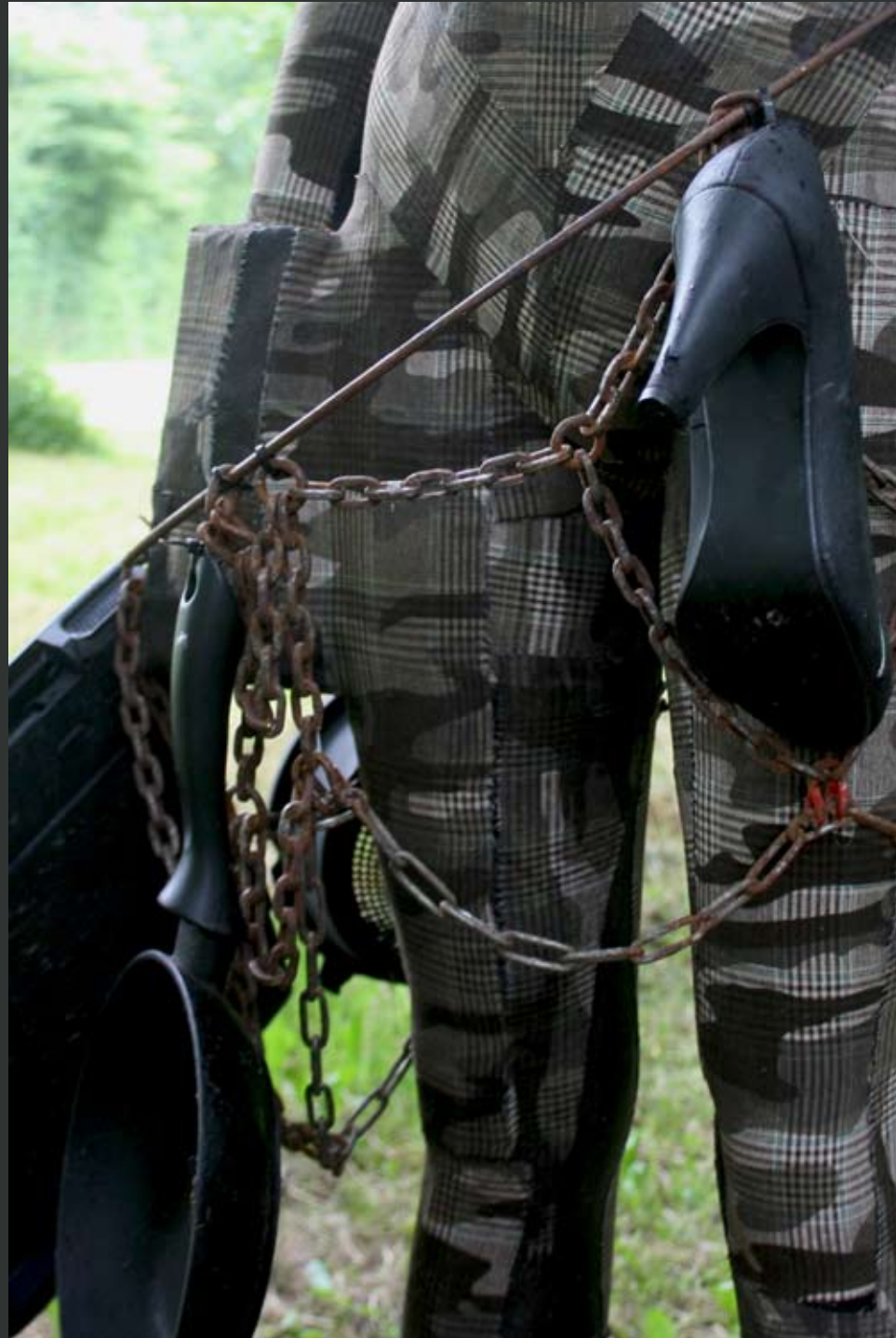
BOMEN OVER VROUWENRECHTEN EN EMANCIPIATIE